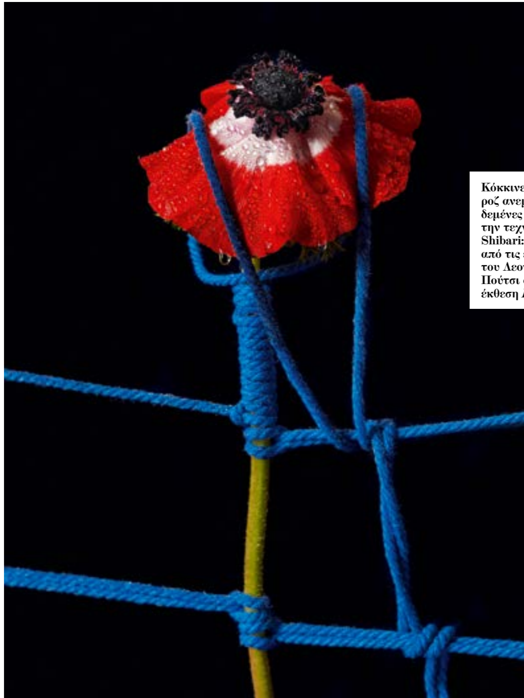
Κόκκινες και ροζ ανεμώνες, δεμένες με την τεχνική Shibari: δύο από τις εικόνες του Λεονάρντο Πούτσι από την έκθεση Flowers .

Ο Ιταλός φωτογράφος παρουσιάζει στην Αθήνα το νέο, βαθιά αλληγορικό του έργο, που «γεννήθηκε» σε περίοδο καραντίνας και είναι εμπνευσμένο από τη στέρηση ελευθερίας και την καταπιεσμένη σεξουαλική ενέργεια.